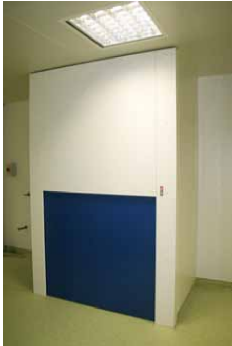
Équipé de portes coulissantes motorisées