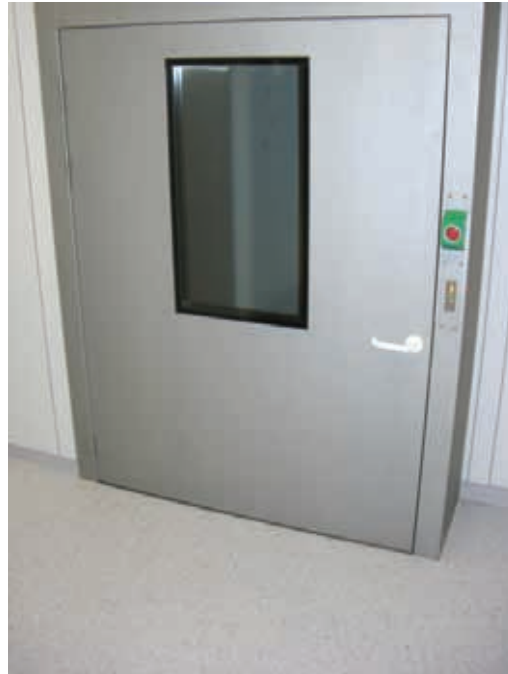
Sas équipé de portes battantes